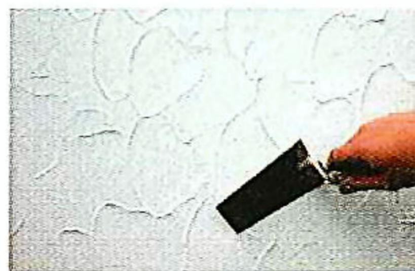
コテで立体感の有るテクスチャー

内装・外壁をお好みのデザインで仕上げることができます。また、天然顔料で着色も可能です。