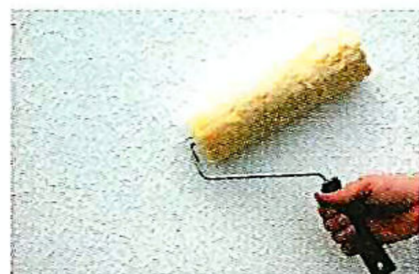
ローラー塗装・吹き付けも可能